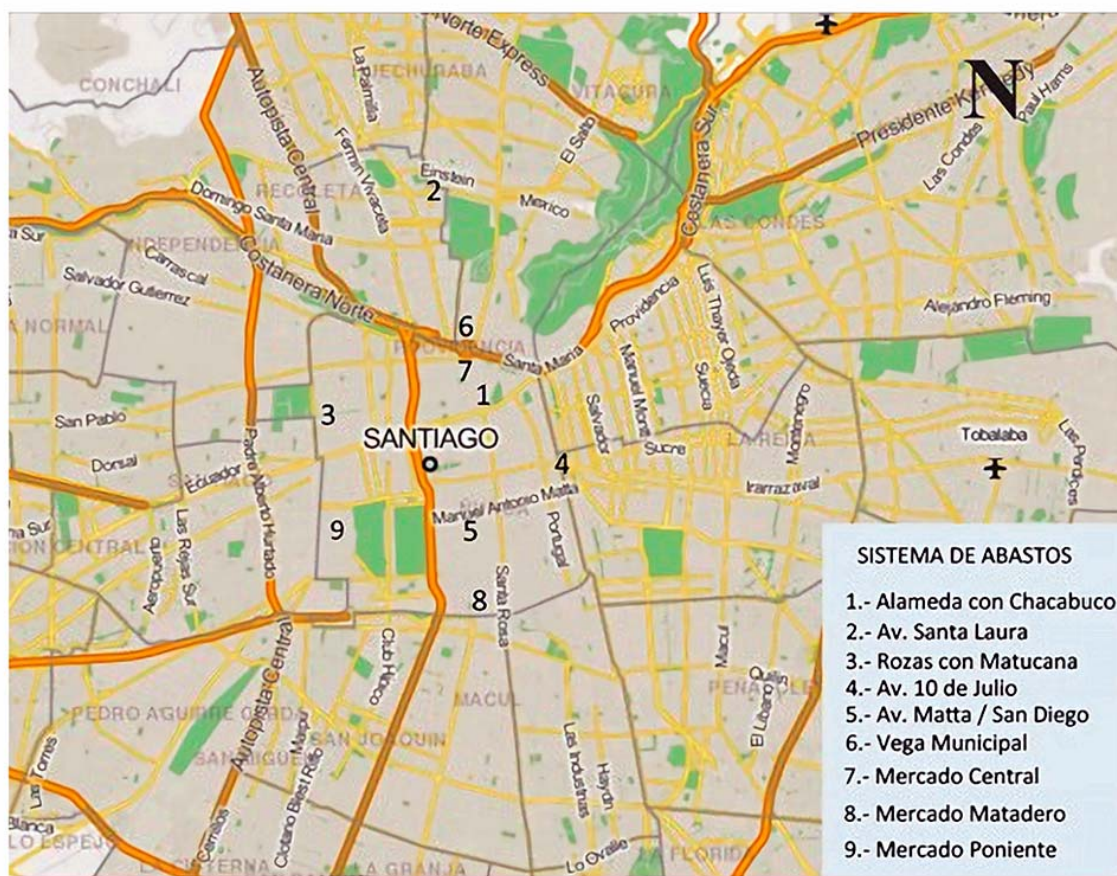
Mapa 1. Sistema de abastos de la ciudad de Santiago. Década de 1930

Las ferias libres se ubicaron en los primeros cinco puntos. Los puntos 6 al 9 corresponden al sistema tradicional de abastos de la capital. Se agradece al profesor Peter Bravo, Universidad de Valparaíso, por el apoyo técnico.