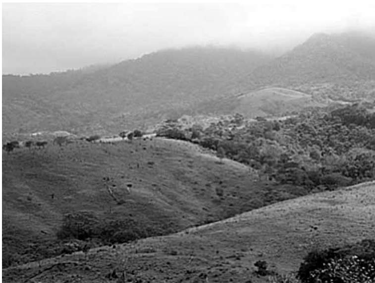
Foto 1. Ejido de Piedra Labrada