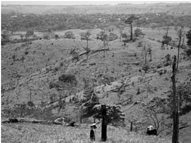
Foto 2. Ejido de Piedra Labrada