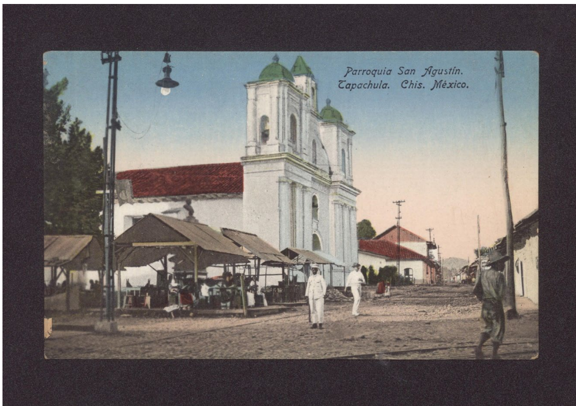
Figura 3. Farola que ilumina la Plaza de la Parroquia de San Agustín, Tapachula