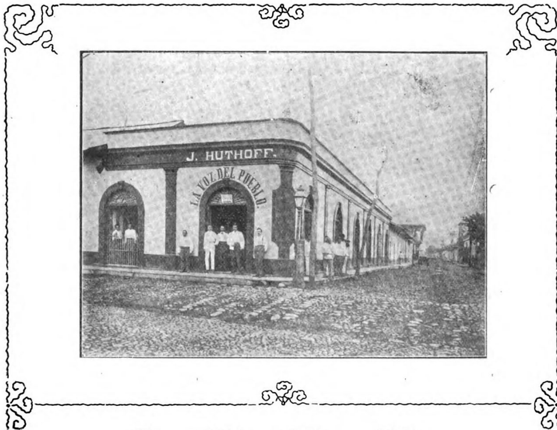
Figura 4. Almacén “La Voz del Pueblo”, propiedad de Juan Huthoff