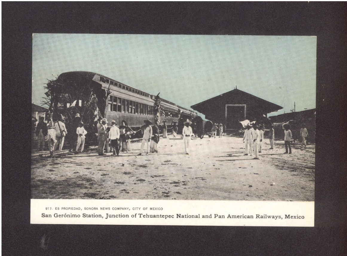
917. ES PROPIEDAD, SONORA NEWS COMPANY, CITY OF MEXICO San Gerónimo Station, Junction of Tehuantepec National and Pan American Railways, Mexico

Fuente: Sonora News Company. Tarjeta Perteneiente al Archivo Histórico Documental de Colecciones Especiales de la Universidad Autónoma de Ciudad Juárez.