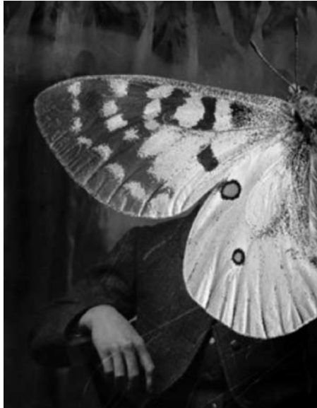
Figura 1. Parnassius apollo .

Jo Whaley, Parnassius apollo . Copyright © 2007 (Publicación autorizada por la artista al articulista).