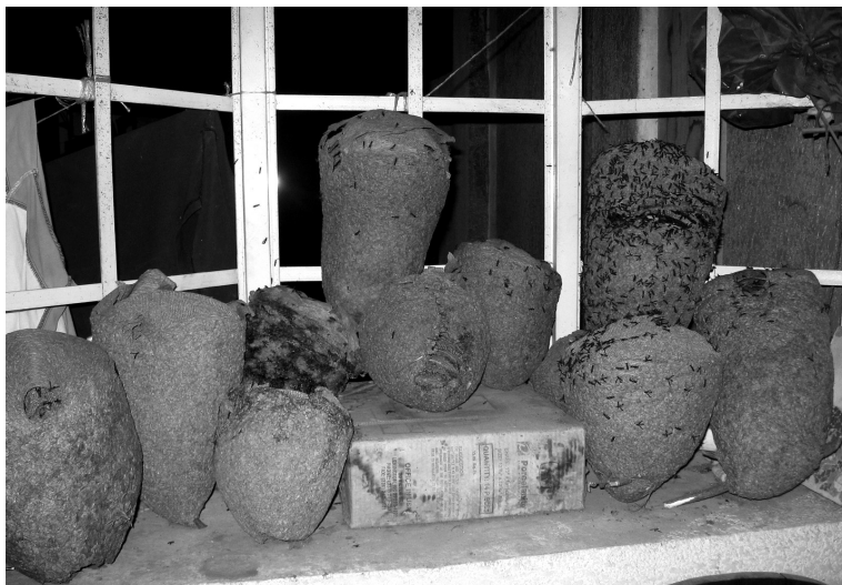
FOTO 1. Panales colectados por panaleros de Cherán (2008).

Predomina el uso genérico de nombre panal o khuipu , aunque algunas diferencias entre ellos se traducen en nombres distintos. El panal está hecho de tierra, agua, fragmentos de flores, hojas y corteza. A las uauapu les gusta morder la corteza del madroño o panangsi ( Arbutus xalapensis ) ya que la masa que obtienen de ella es más resistente y maleable.