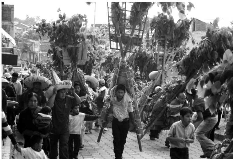
Foto 6. Los panaleros al llegar a El Calvario en la víspera del Corpus.

A lo largo de los recorridos, tanto en la víspera como en el Jueves de Corpus, diversas personas le presentan, a manera de reconocimiento, un canasto con fruta y otros bienes de consumo. De manera paralela, y durante los días que el carguero esté cumpliendo con la instalación del ranchito y la elaboración de la comida una vez que regresan al pueblo para prepararse para la Bajada de los Panaleros, un grupo numeroso de mujeres y de composición cambiante, se mantiene preparando los alimentos que habrán de ofrecer a los panaleros y a otras personas que lleguen a acompañarlos. Unas y otras son expresión de las ayudas mutuas que sostienen la organización del ceremonial; compromisos que se sellan cuando la mujer que ofrece o presenta la ayuda ata un listón de color en la trenza de la carguera. Portar un gran atado de coloridos listones, es muestra de la cantidad de gente que, como cargueros, los ha acompañado y con quienes se ha establecido o se mantiene vigente un compromiso marcado por la reciprocidad.