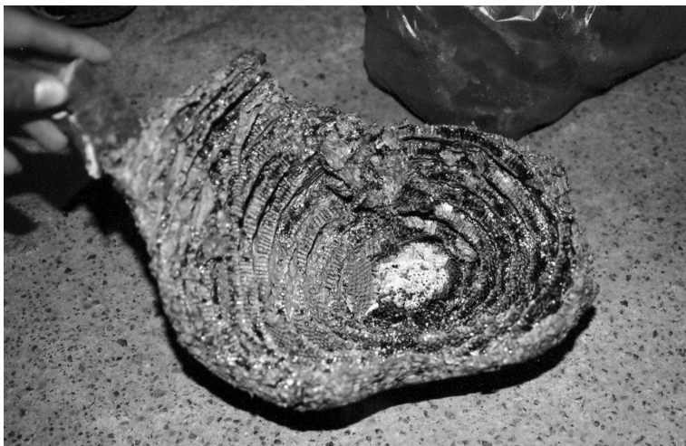
Foto 2. Corte transversal del panal que muestra el ombligo y la “natita”.

también ombligo y tiene un ojo. En el panal, a manera de vientre, está la reproducción.