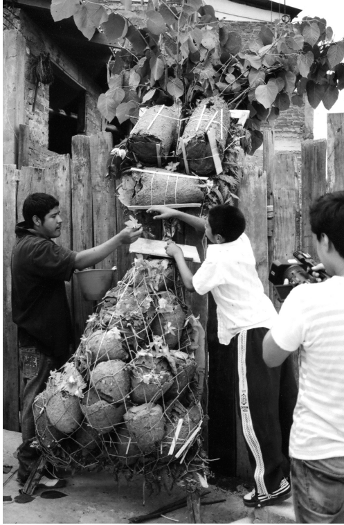
FOTO 5. Armando la katánakwa .

ir a colectar, “aquí nadie nos manda, vamos porque nos gusta la miel y los gusanitos y mero pues andar en el cerro. Todo el tiempo es bonito, cuando niños y jóvenes, con el papá o con el abuelo. Mi abuelo, nos decía un panalero del barrio primero, iba tocándoles el son del Corpus a las abejas cuando salía a buscar panales”. Pero además del gusto, hay la certeza de que se necesita mucha habilidad y suerte para encontrar los panales. Se inician en estas tareas de manera directa al integrarse a algún grupo “entre ellos se van enseñando”, pero se reconoce que además se requiere de habilidades que no todos tienen. Ello no excluye las enseñanzas que fluyen de padres a hijos en éste y otros ámbitos de la vida cotidiana.