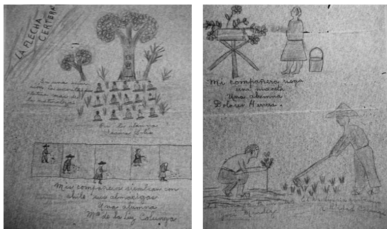
IMÁGENES 7 y 8. La Flecha Certera , año I, tomo II, febrero 28 de 1929.

servar cómo se distribuían las imágenes en los códices, los recuadros para separar actividades o, bien, expresar diferentes aspectos de una misma actividad, y la forma de explicar en grafías lo que se está pintado, como se hacía en los dibujos de La Flecha Certera , que en su momento también se expresaron en Zoolomecatl . Esto nos conduce a afirmar que el trabajo que los niños empleaban en elaborar estos dibujos era muy cuidadoso, en el que se invertía más tiempo, lo que muy probablemente significaba que existieron borradores previos hasta llegar a buen resultado, los dibujos de alguna manera eran los trabajos más visibles de los niños. Situación distinta que ocurría en los artículos escritos, en los que hay borrones, enmendaduras, letras sobrepuestas; es muy probable que las maestras y los padres de familia se vieran involucrados en la elaboración de dichos trabajos, evidenciando una relación estrecha y, por qué no, en un plano democrático en el cual los niños participaban de la mano de los adultos.