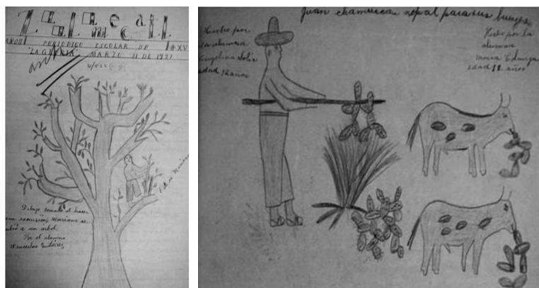
IMÁGENES 3 y 4. Zoolomecatl , año II, núm. XV, marzo 31 de 1927.

que es representado encaramado en el árbol vistiendo un pantalón, desnudo del torso, descalzo y sin sombrero.