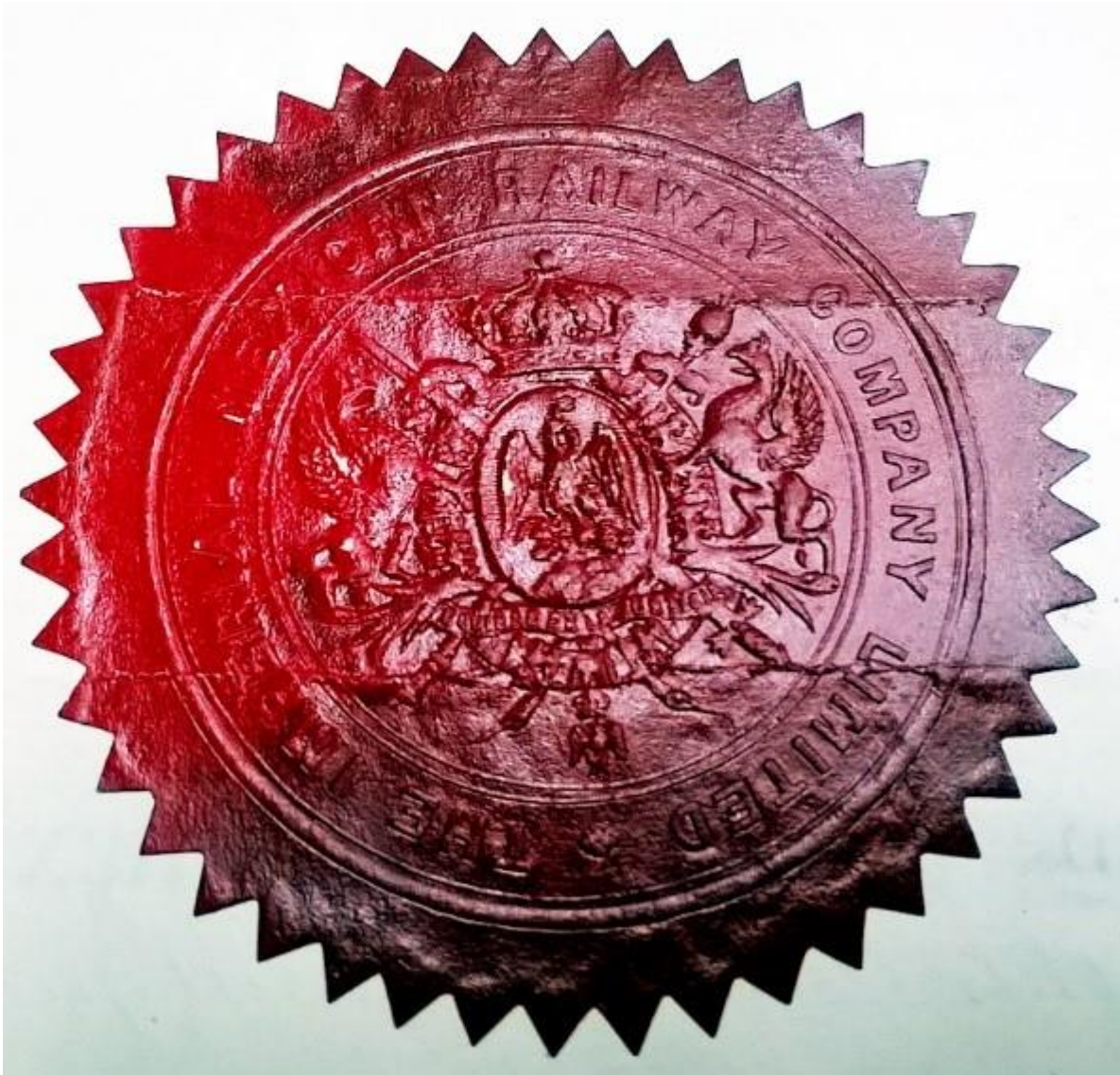
Imagen 3. Sello en cera de la Compañía Imperial Limitada